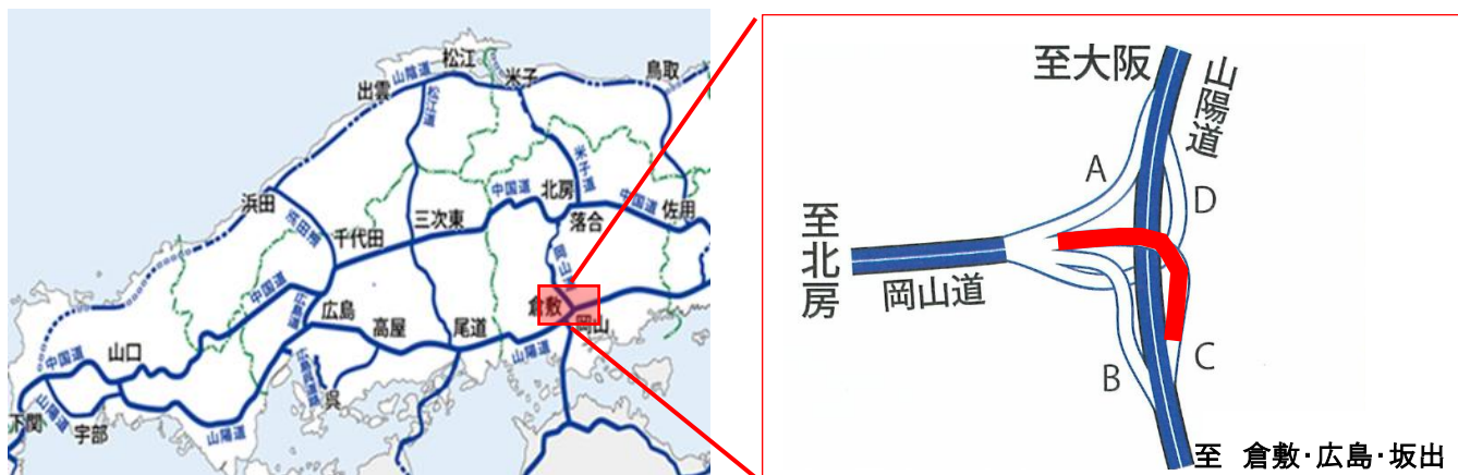
E73 岡山自動車道 岡山 JCT(倉敷・広島・坂出方面)