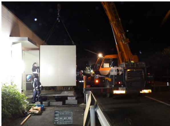
< 消火ポンプ盤取り替え >

4 車線化工事における消火ポンプ盤取り替え、規制材撤去および新たな料金切り替え作業などを行います。