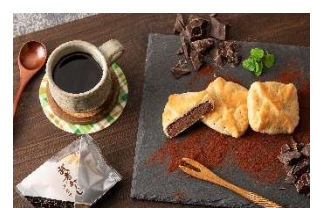
武者返し ショコラ