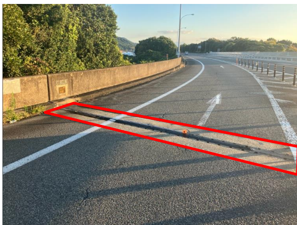
《 施工前 》