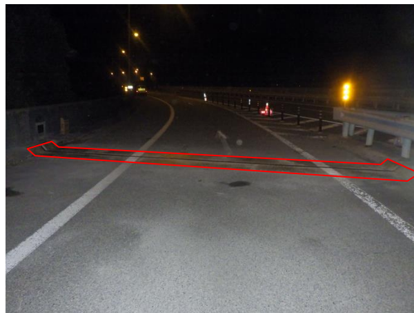
《 施工後 》