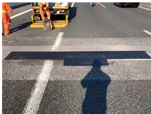
補修作業完了状況