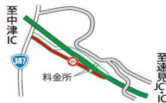
《院内 IC 出口》