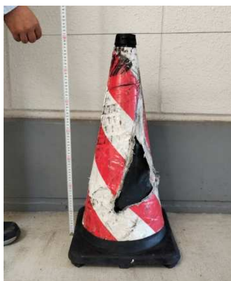
回収したラバーコーン 1本 (35 cm角 高さ71 cm 重量 4.5 kg)