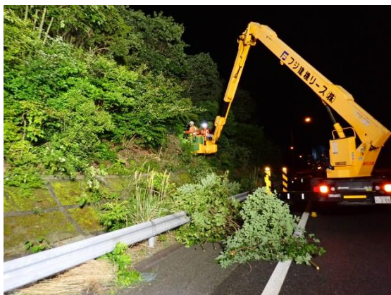
《樹木伐採作業状況》