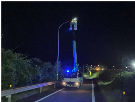
<道路照明設備点検>