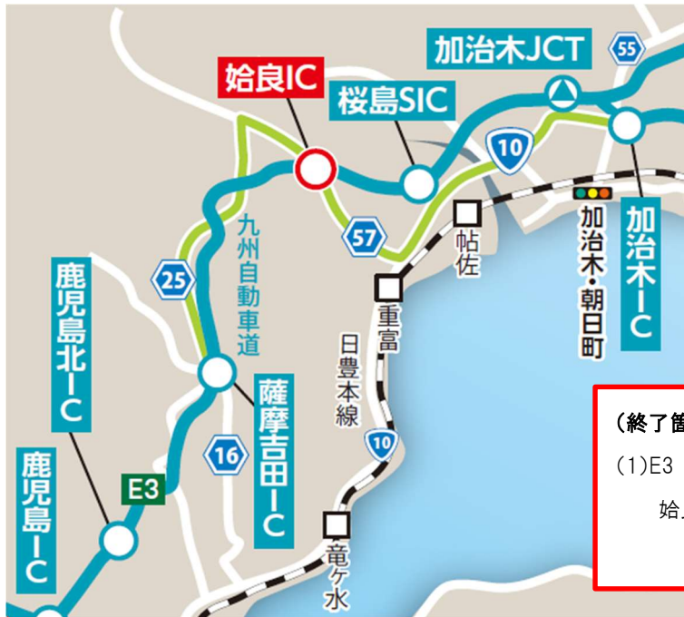
夜間通行止め、IC 夜間閉鎖位置図

(終了箇所) (1)E3 九州自動車道 始良 IC 夜間閉鎖 5/8(水曜)夜~5/9(木曜)朝