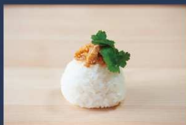
トムヤム豚パクチー 400円