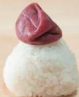
すっぱい梅干しおむすび