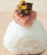
高菜明太おむすび

※作り切れ次第販売終了の可能性がございます。 ※仕入れ単によりメニューは変更の可能性があります。 ※お持ち帰り可能なパッケージしたものを販売いたします。