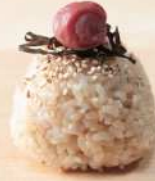
玄米梅昆布おむすび