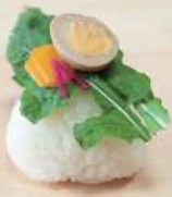
うずらの卵の漬けおむすび