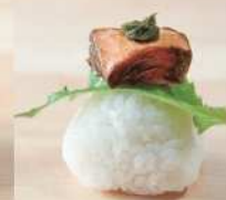
焼き鮭甘酢おむすび