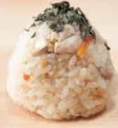
丹波鶏の炊き込みおむすび