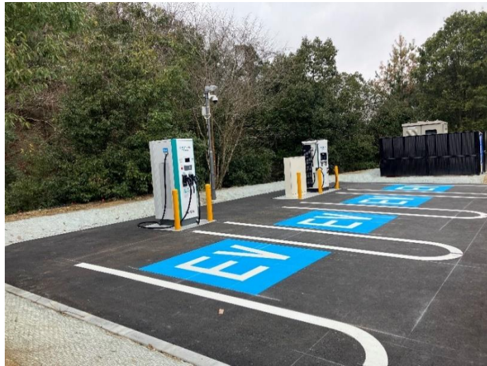
急速充電設備 (E2 山陽道 福石 PA 下り線)