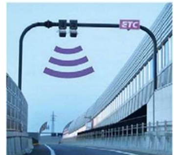
ETCフリーフローアンテナ

佐々IC～佐世保大塔IC間では、ICの出入口に設置するETCフリーフローアンテナにより、ETC無線通信で走行区間を判別します。 高速道路の通行中はETCカードをETC車載器から抜かないでください。