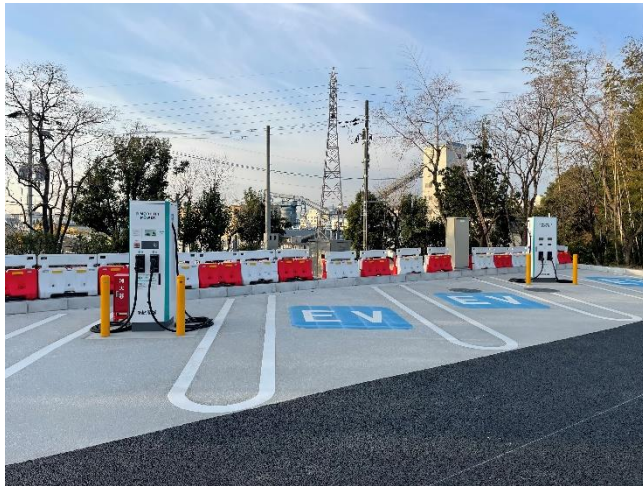
急速充電設備 整備イメージ (参考:E1 名神 桂川PA 下り線)