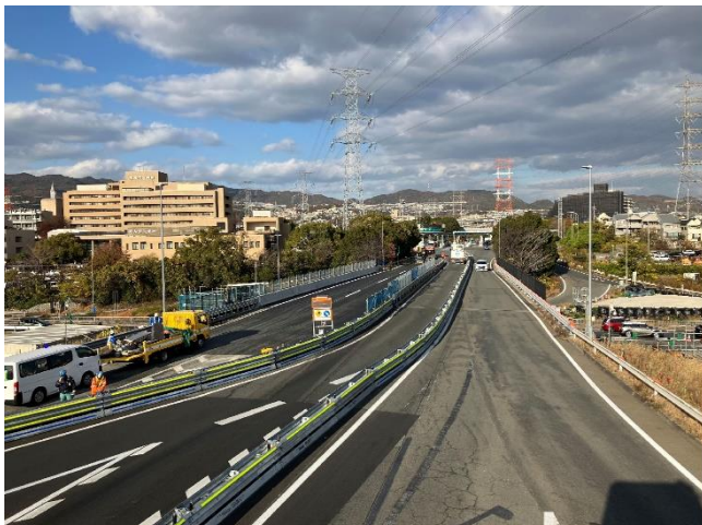
対面通行規制状況