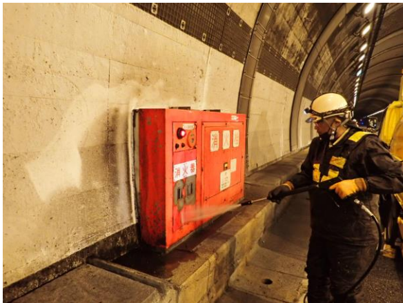
《設備点検作業状況》