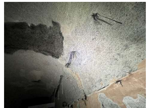
トンネル側面の剥離