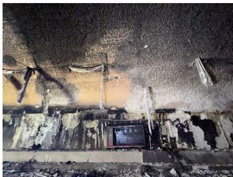
火災後のコンクリート表面