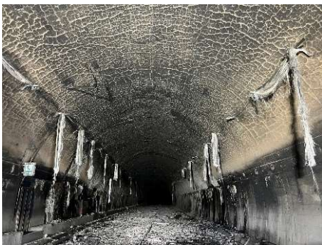
トンネル内部(全景)