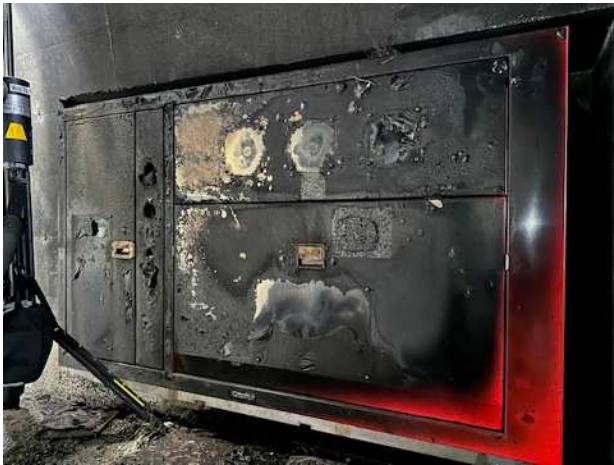
(消火栓設備被災状況 16日 14時40分時点)