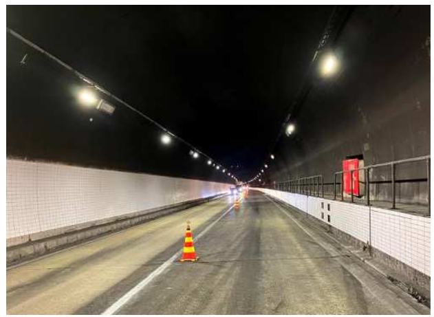
(復旧後 17日 10時50分時点)