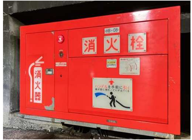
(復旧後 17日 10時50分時点)