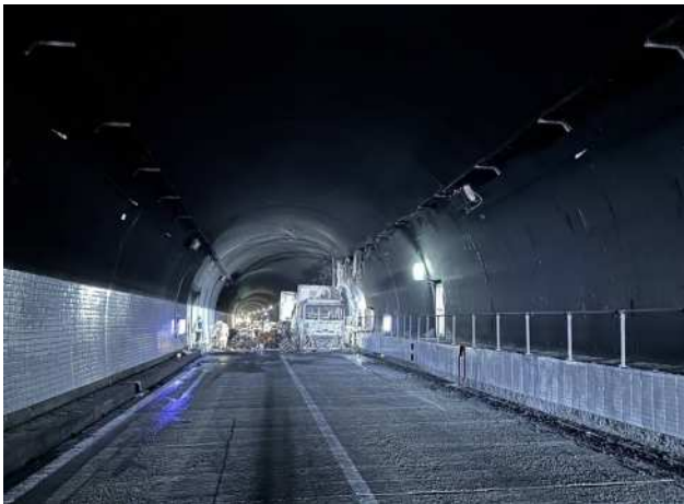
(トンネル照明設備被災状況 16日 14時40分時点)