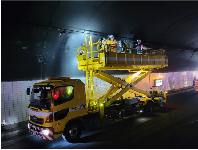
(トンネル照明設備点検・復旧作業 20時50分時点)

現在、火災により損傷したトンネル照明等の設備およびトンネル覆工の点検・復旧作業を実施しております。早期の通行確保に向けて全力を尽くしてまいります。