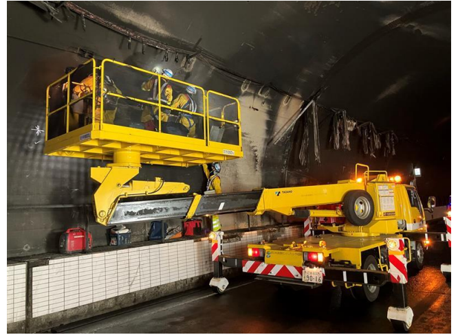
(トンネル覆工点検・復旧作業 18時50分時点)