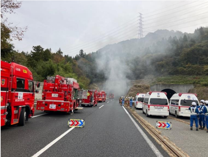
(11/16 11:17 撮影)