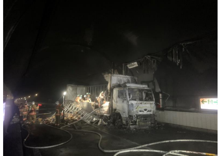
(11/16 14:20 撮影)