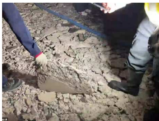
剥離したコンクリートが路面に散乱