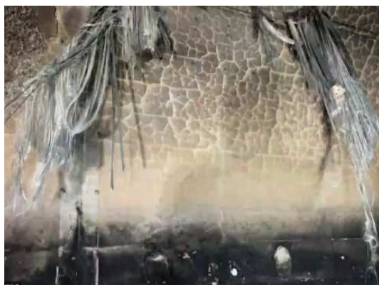
コンクリート表面の亀甲状のひび割れ