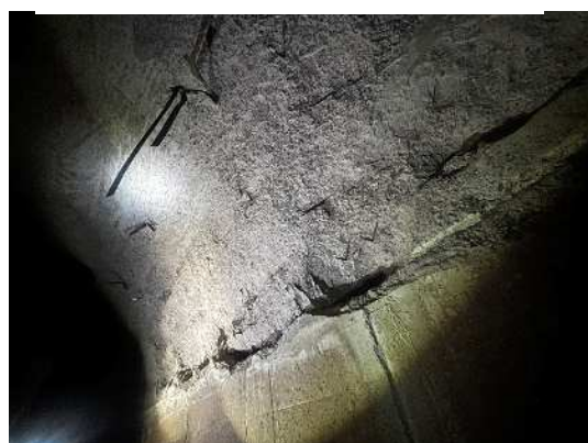
トンネル側面のコンクリートの剥離