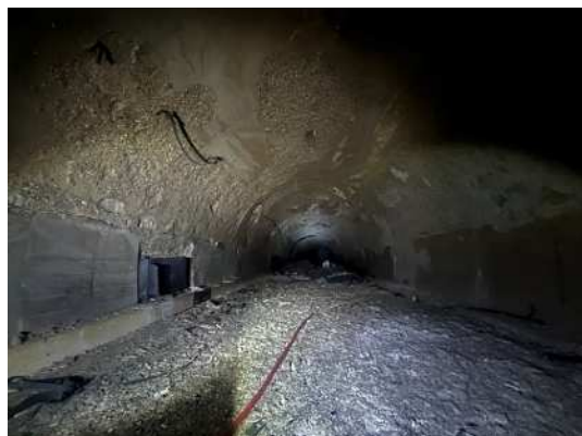
トンネル内部(全景)