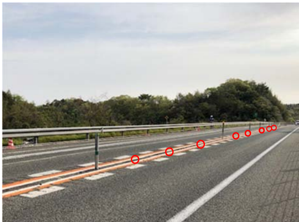
○: 支柱復旧必要箇所(8本)