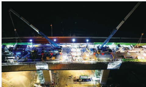
床版取替状況(境谷橋)

阪和自動車道阪南IC～和歌山IC間は、1974年(昭和49年)の開通から約50年が経過し、老朽化も進んでいます。そこで、阪和道をはじめ関西エリアで既設橋梁を撤去し、新たに橋梁を架け替える抜本的なリニューアル工事を進行しています。今まで以上に耐久性のある高速道路に進化させ、100年先の安全・安心な高速道路をかたちにし、さらなる快適な移動時間の提供を目指していきます。みなさまのご理解、ご協力をお願いします。