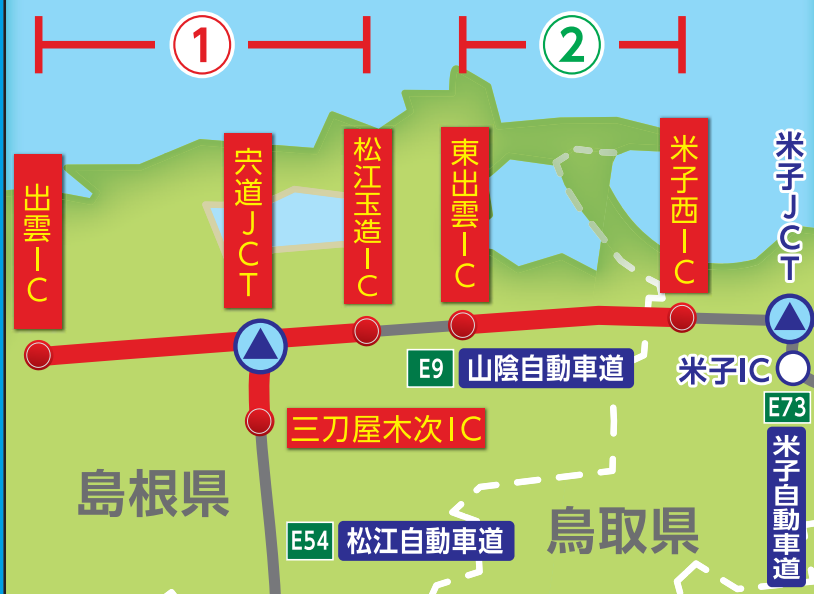
通行止め区間の位置