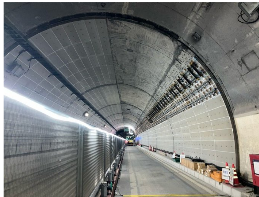
トンネル覆工内巻き工 施工状況