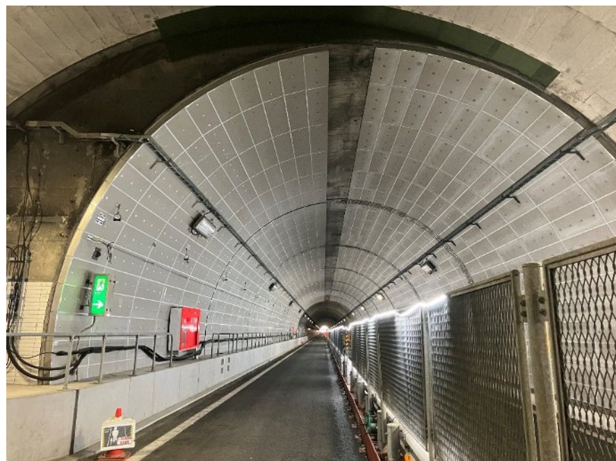
工事規制STEP⑤ 完了状況(至 川之江JCT側)