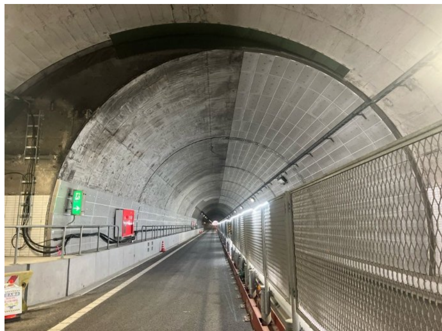
トンネル内照明撤去後