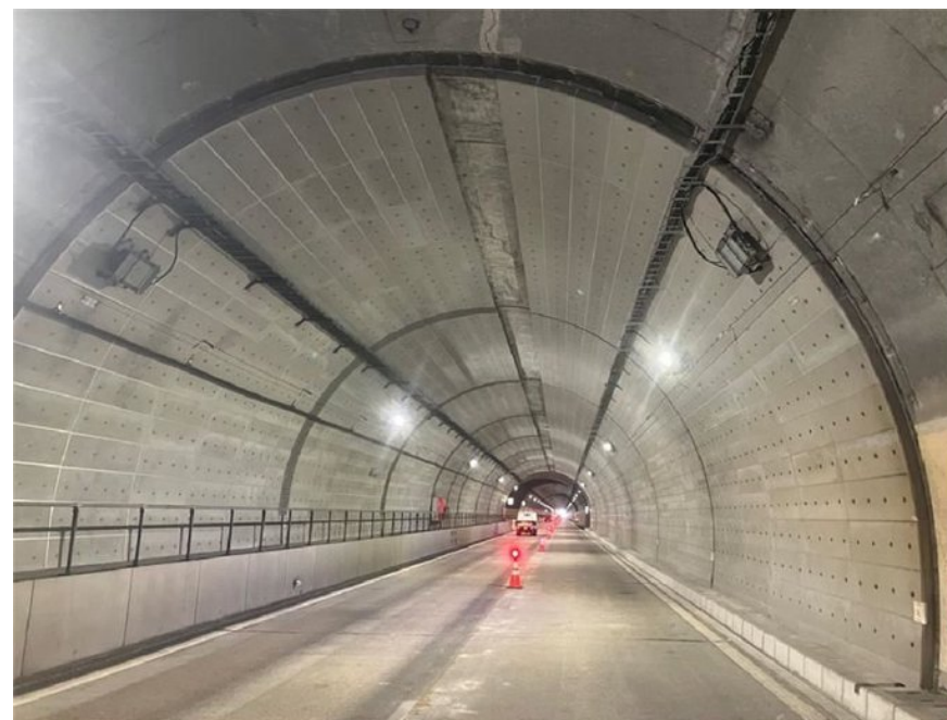
工事規制STEP⑤ 完了状況(至 松山側)