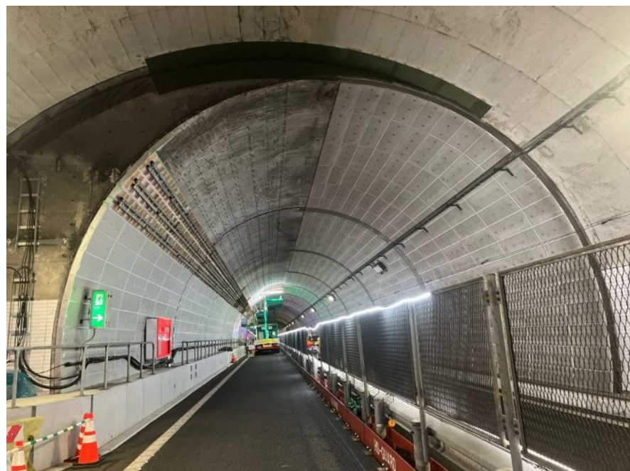
トンネル覆工内巻き工 施工状況