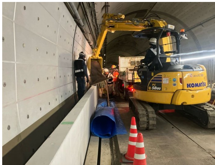
監視員通路復旧(走行車線側)