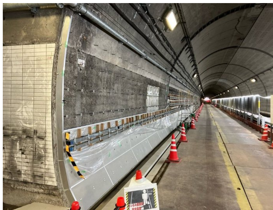
トンネル覆工内巻き工 作業状況(全景写真)