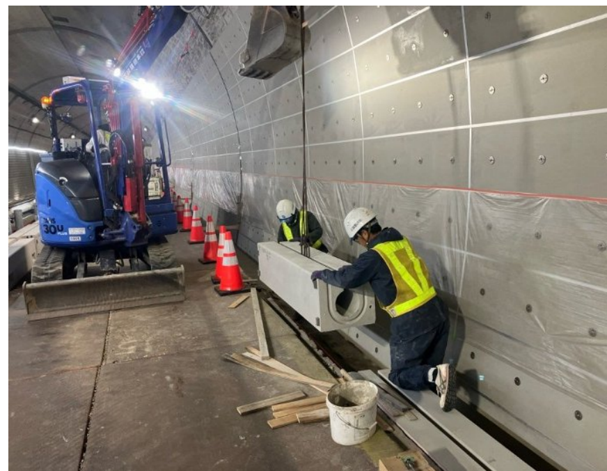
監査廊復旧(追越車線側)