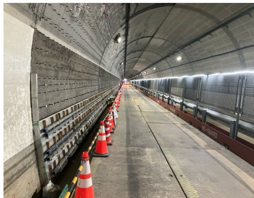
トンネル覆工内巻き工 作業状況(全景写真)