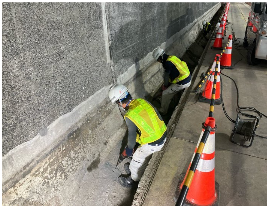
アンカーの削孔状況