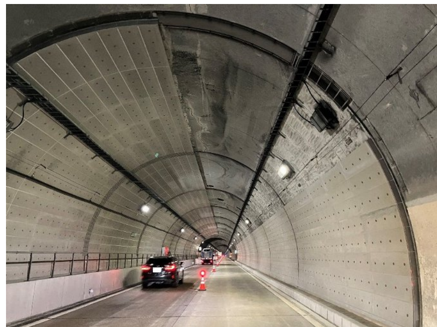
工事規制STEP④ 完了状況(至 松山側)