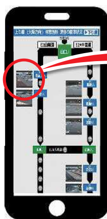
休憩施設(駐車状況)