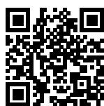
広島県警察 公式 Twitter