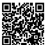
広島県警察 サミット対策課HP

高速道路の交通規制予定期間及び予定路線等や交通規制に関するQ&Aなどが確認できる広島県警察のサイトです