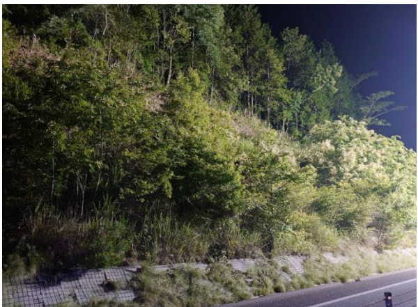
《 施工前 》