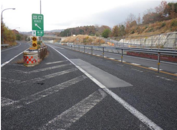
《 施工前 》