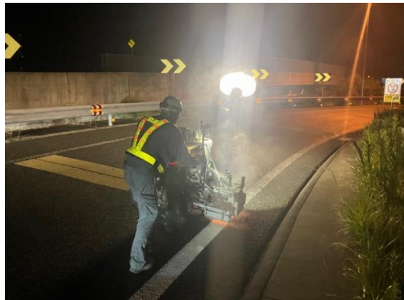
《路面標示作業状況》