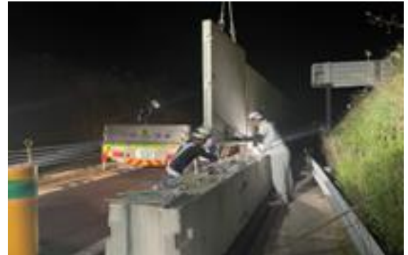
<バリアウォール移設作業>