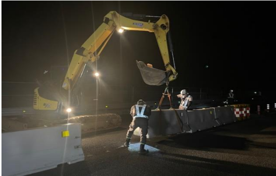
<仮設防護柵設置工事>