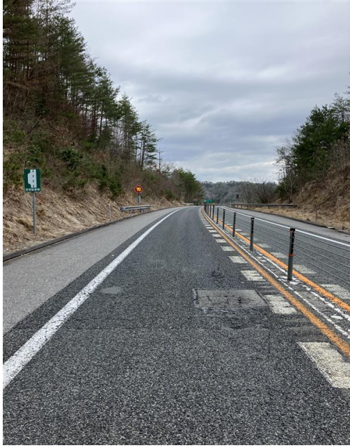
《 施工前 》