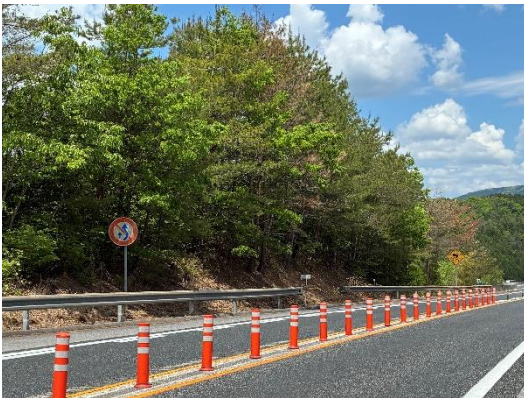
《 施工前 》