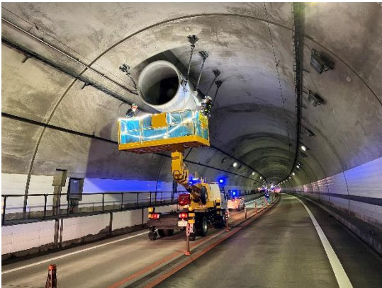
《ジェットファン清掃状況》