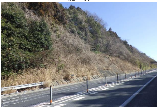
《 施工前 》