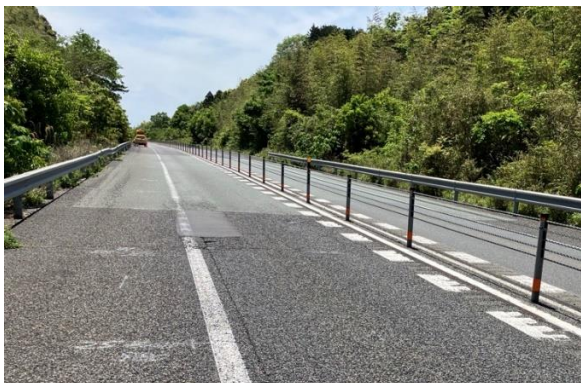
《 施工前 》