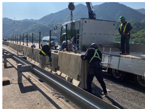
車線を拡幅するために必要となる 仮設防護柵の設置