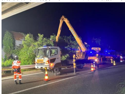
樹木の せんてい 剪定