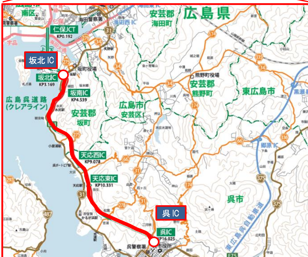
E31 広島呉道路 坂北 IC～呉 IC 間(上下線) 夜間通行止め