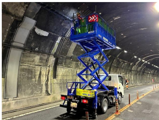
<トンネル照明設備清掃>