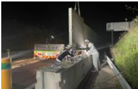
<バリアウォール移設作業>