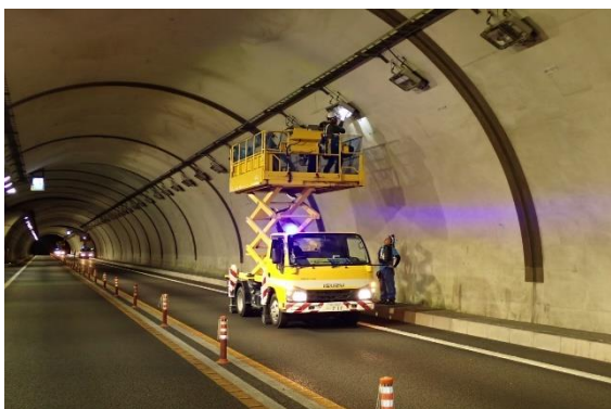
<トンネル照明点検作業>