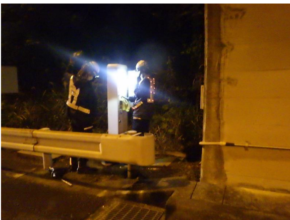
<非常用電話設備点検>