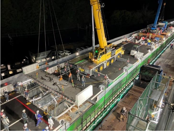
《新設 PC 床版設置状況》