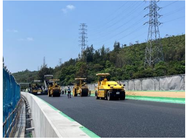
舗装工事の作業状況