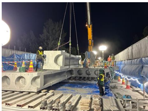
損傷した床版の撤去作業状況