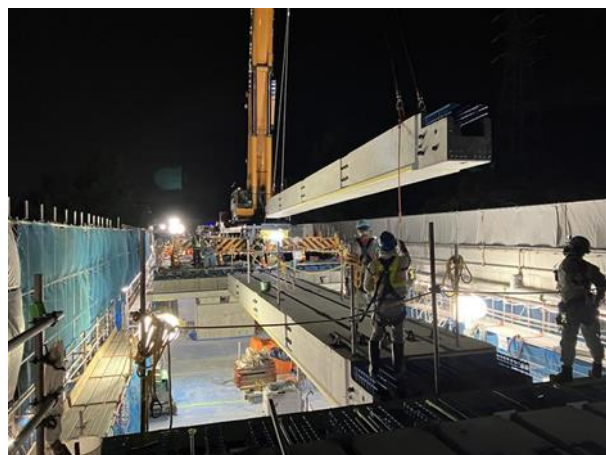
新設床版の設置作業状況