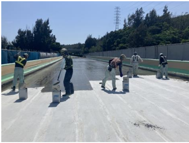
床版防水工事の作業状況