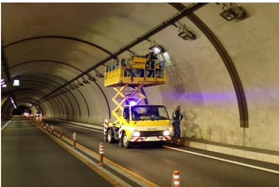
<トンネル照明点検作業>