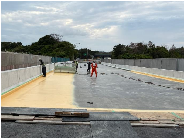
床版防水工事の作業状況