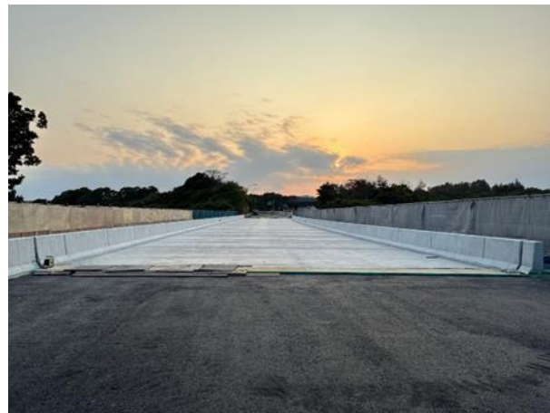
床版取替 施工後(床版防水工事施工前)