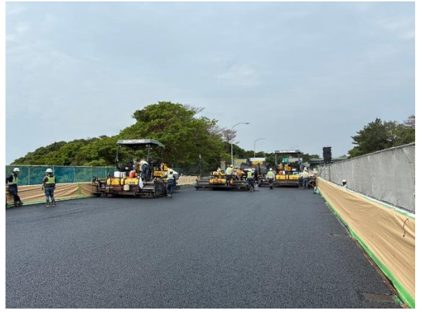
舗装工事の作業状況