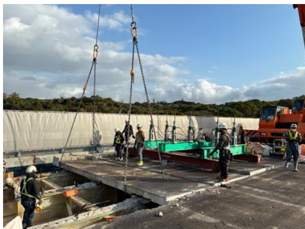
損傷した床版の撤去作業状況