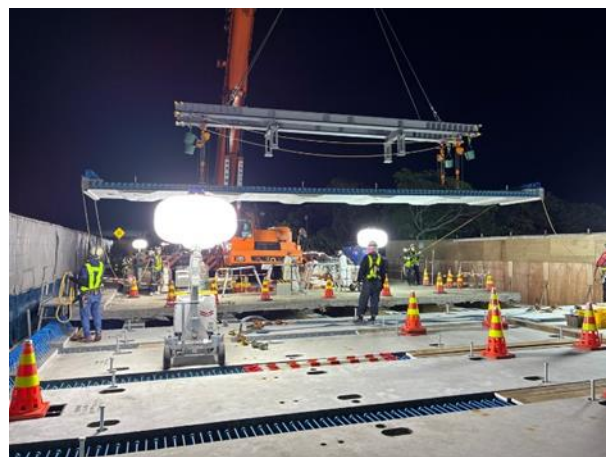
新設床版の設置作業状況