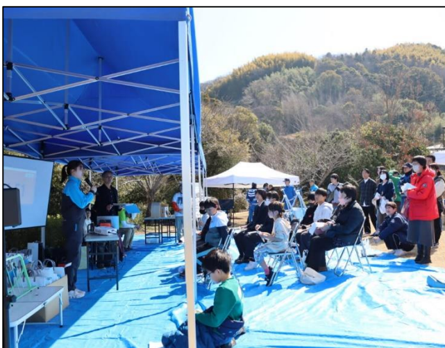
読書をテーマにしたイベント(ビブリオバトルの開催)