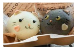
にやんだまん(イメージ)

伊予灘 SA で人気の「にやんだまん(税込 630 円(1 個))」に加え、ピクニックエリアで食べやすいホットスナックを各種ご用意しています。