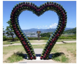
ハート型ピアリー (伊予灘 SA 上り線)

令和 5 年の第 2 期では、ハート型ピアリーと園地景観との調和を目的とした園地改良を実施。令和 6 年の第 3 期では、伊予灘 SA 下り線にピクニックエリアを新設し、記念イベントとしてブックイベントを開催しました。