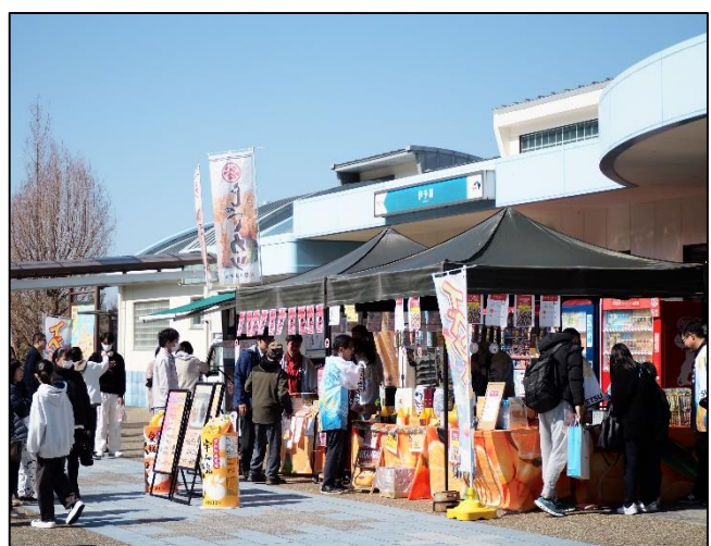
飲食販売コーナー