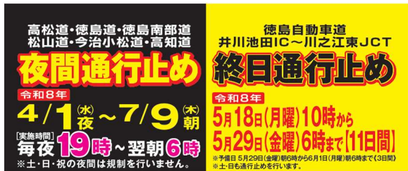
工事専用ウェブサイトバナー