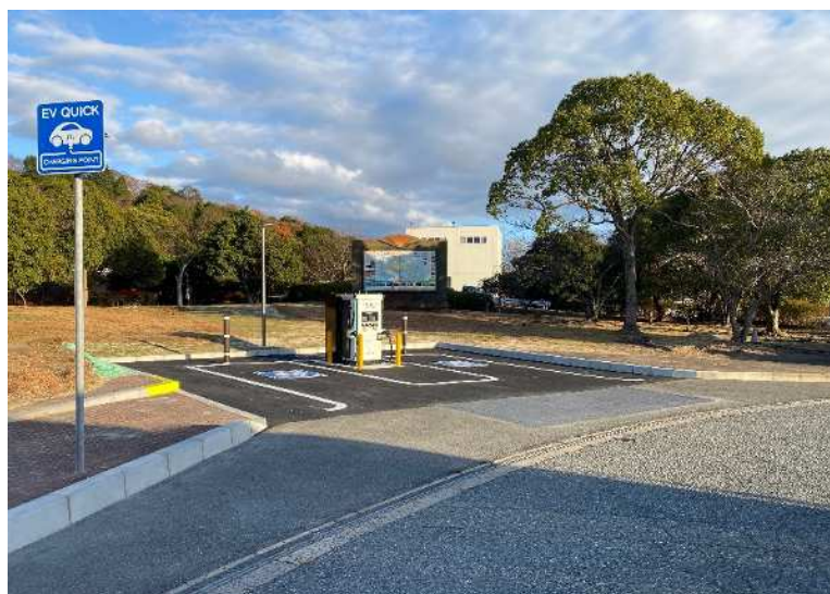
急速充電設備 設備イメージ (参考 E2 山陽自動車道 佐波川 SA 下り線)