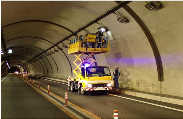
＜トンネル照明点検作業＞

路面の舗装・トンネル付属物(照明設備、非常用設備)・橋梁・道路付属物(路面標示など)を常時良好な状態に保つための補修・点検・清掃などを行いました。