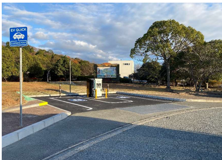
急速充電設備 設備イメージ (参考:E2 山陽自動車道 佐波川 SA 下り線)