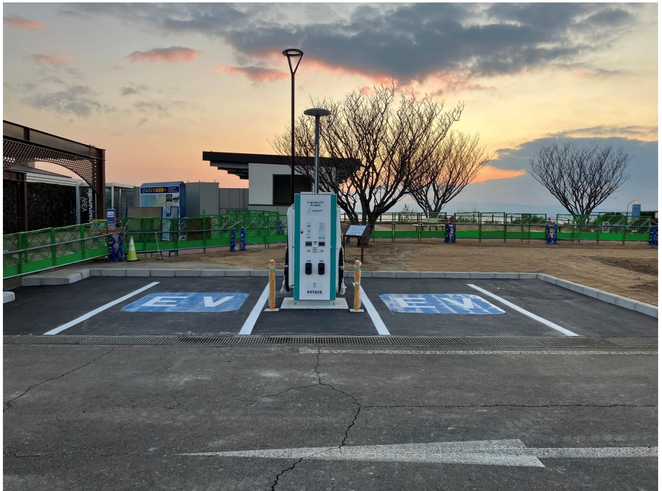
急速充電設備 (参考:E34 長崎自動車道 大村湾PA 下り線)