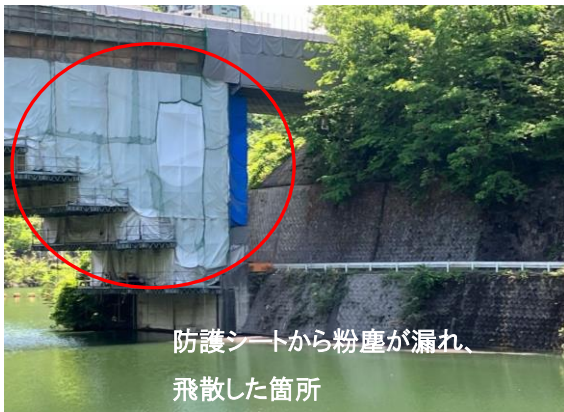
粉塵飛散防護シートの設置状況