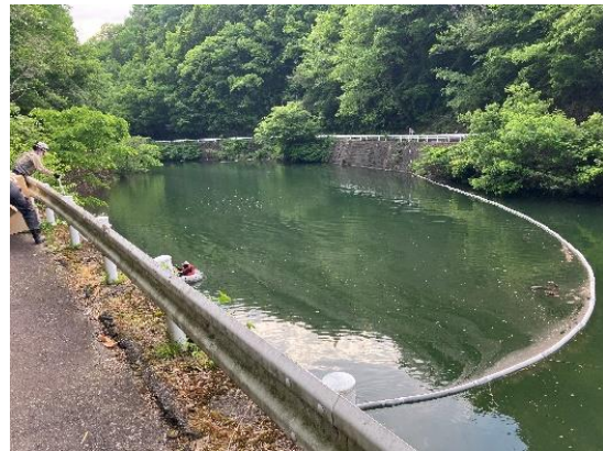
拡散防止フェンス設置状況(5月15日設置)