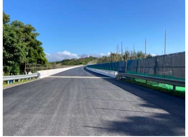
床版取替 施工後(床版防水工施工前)