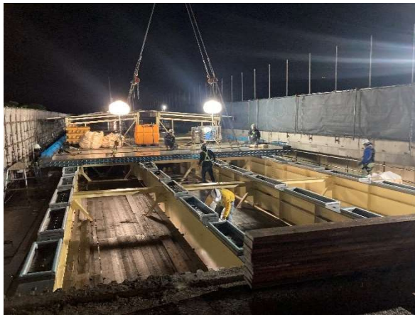
新設床版の設置作業状況