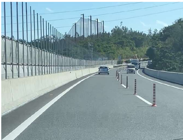
対面通行規制状況