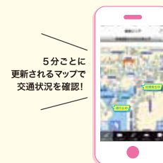
5分ごとに更新されるマップで交通状況を確認!