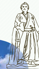
長崎の夜景スポットとして人気が高い