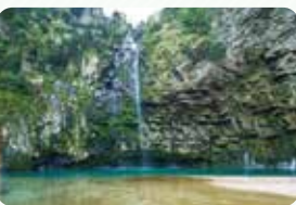
正面から滝を眺めると、岩肌の荒々しさと相まって迫力いっぱい

☎ 0952-41-7550 📍 佐賀県佐賀市城内2-18-1 🌐 https://saga-museum.jp/sagajou/